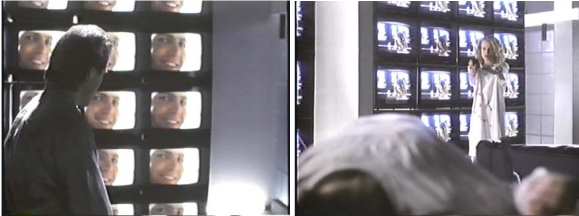
Abb. 8 / 9

Das minimalistisch angelegte Interieur hat einen starken Fokus auf vertikal-horizontaler Linienführung, wobei wiederum Sichtfenster/Monitore suggeriert werden. Die Farbenpalette ist fast im gesamten Film reduziert, insbesondere in den im Atelier/Gants Wohnung spielenden Sequenzen: schwarz, lichtdurchflutetes Weiß, mit roten Akzenten in den Requisiten (Tücher, Früchte) oder der Kleidung, angereichert durch bläuliches „TV-Licht“. Diesem Gestaltungselement scheint auch geschuldet, dass der eigentlich dunkelhaarige Darsteller des Mikael Gant platinblond gebleicht wurde, was ihn zu einem ätherischen Beinahe-Schwarzweißobjekt in einer fast schwarzweißen Umgebung macht (Abb. 10-13).